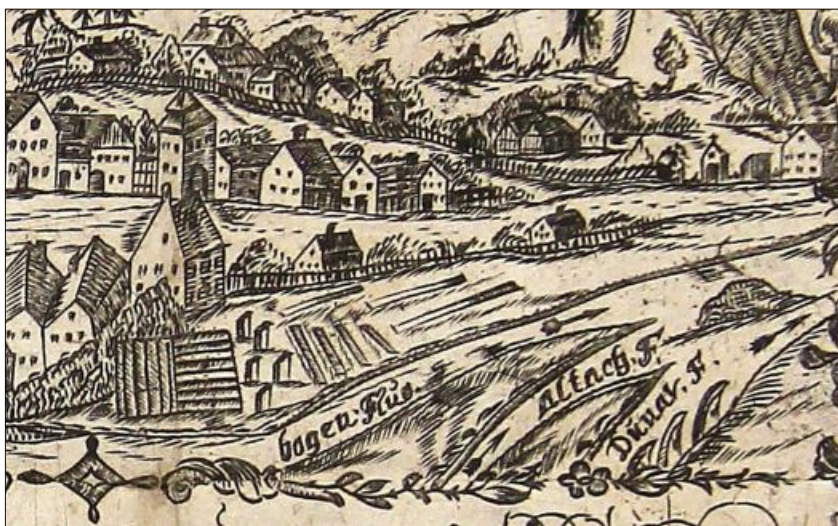
Auf dieser Abbildung: Unteres Tor, Mauthaus, Flüsse und Marienstein.

schiff angebaut war ein kleines Mesnerhaus, das nach Umbauten im Jahre 1825 als erstes Bogener Schulhaus verwendet wurde.