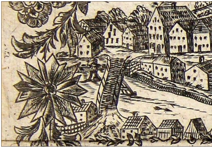
Diese Zeichnung zeigt die Bogenbachbrücke und die Gerbereien.

Die drei marktprägenden Gebäude befanden sich 1781 in enger Gemeinschaft. Die Florianikirche, 1486 erbaut, war beim Großbrand 1719 eingäschert worden. Drei Jahre später gab man dem neuen Turm eine Zwiebelhaube, die nur ein gutes Jahrhundert überstand. Denn 1836 wurde der Turm bei einem Feuer in der gegenüber liegenden Häuserreihe wieder zerstört, wobei „die zwei Kuppeln und das Gebälk in Asche gelegt wurden“, wie es in einer authentischen Urkunde heißt. Beim Wiederaufbau entstand schließlich der heutige Spitzturm der Kirche. Am Kirchen-