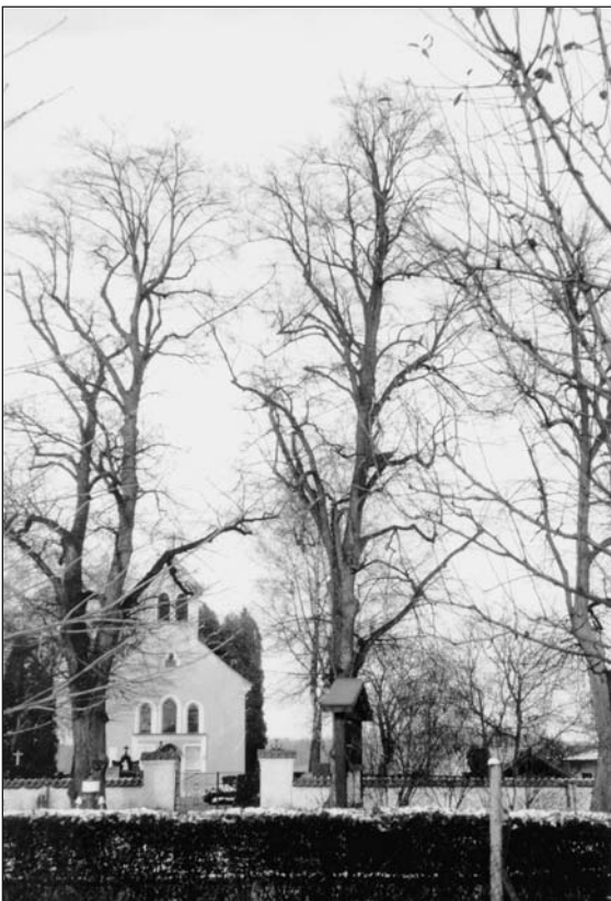
Die Linden am Friedhof sind zehn Jahre älter als die Friedhofkapelle St. Josef, die im Jahre 1844 im schlichten Stil des 19. Jahrhunderts erbaut wurde.