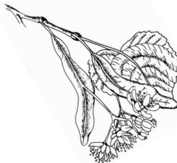
Blüte der Winterlinde