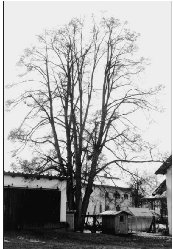
Hoflinde in Weingarten

Mitterfels entlang gehen sieht: unterwegs zu einem Kunden, denn er ist in seinem hohen Alter immer noch erwerbstätig.