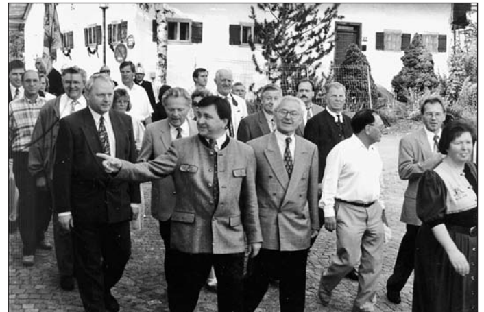
Viele Ehrengäste waren zum Fest gekommen