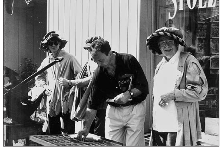
Die alte Stolz'sche Druckmaschine kam wieder zu Ehren