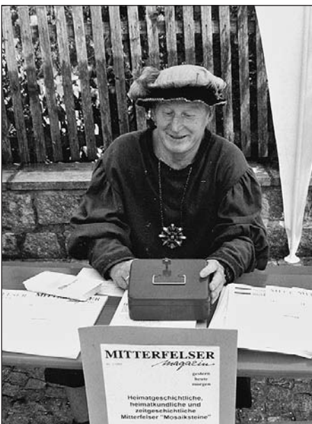
Die Erstnummer des Mitterfelser Magazins 1/95 war auch Festschrift