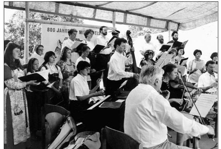
Salonorchester und Singkreis spielten und sangen im Burghof