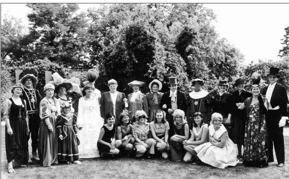
Die historische Modenschau und die Bademodenschau (hier bei der Probe) fanden große Aufmerksamkeit