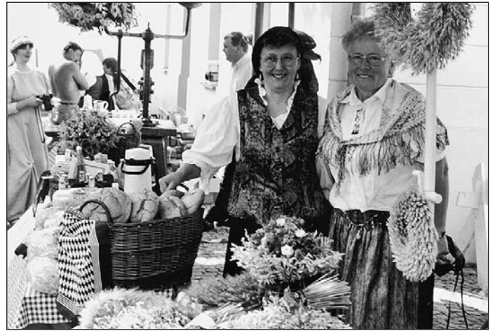
Bei der St. Georgskirche fand ein historischer Markt statt