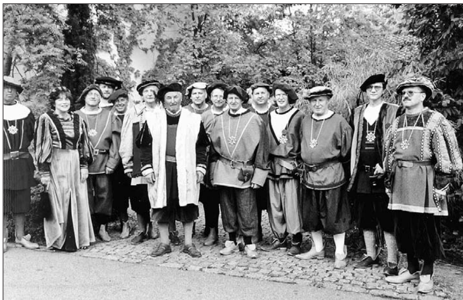
1. Bürgermeister und Marktgemeinderäte in historischer Tracht