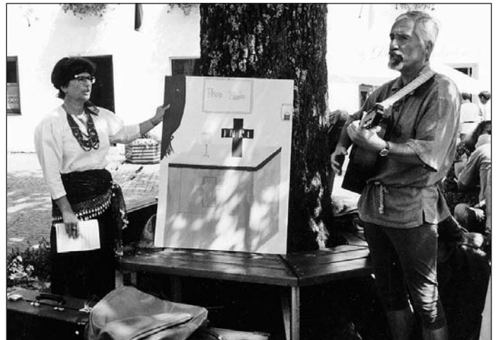
R. und G. Hopfner: die traurige Ballade der Agnes Bernauer