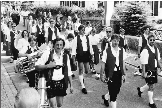
Die Blaskapelle marschierte dem Festzug voran