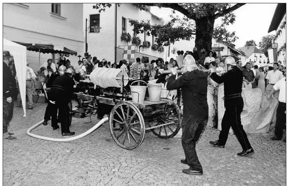
Die Feuerwehr in hist. Uniformen löschte mit Geräten von anno dazumal