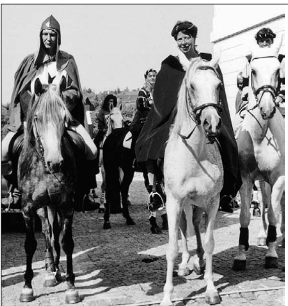
Ritter und Edelfrauen hoch zu Roß