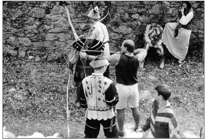
Die Schützen veranstalteten ein Bogenschießen