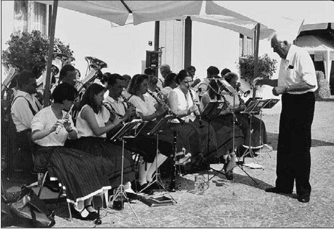
Die Blaskapelle spielt in der Burgstraße auf