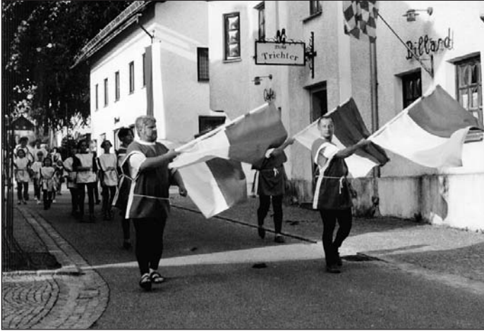
Der TSV Mitterfels zeigte sich schwunghaft, ....