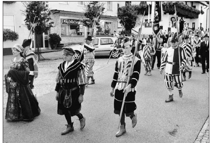
Die kgl. priv. Schützengesellschaft trug Hellebarden