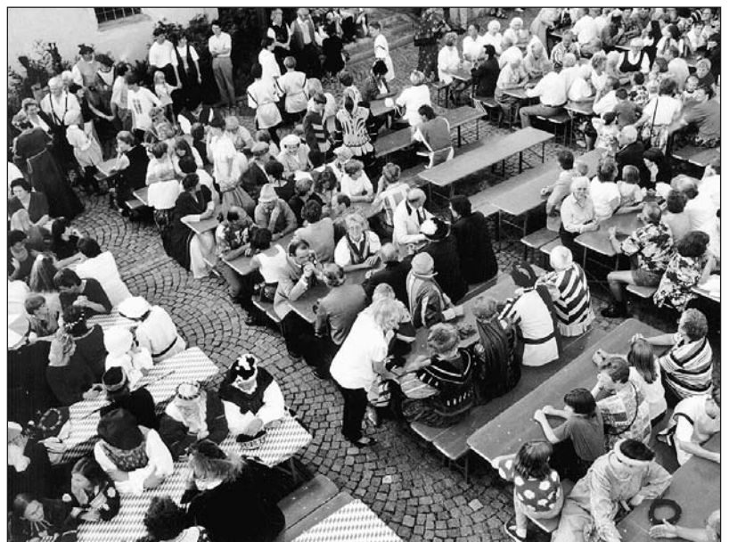
Nach dem Festzug füllte sich der Burghof