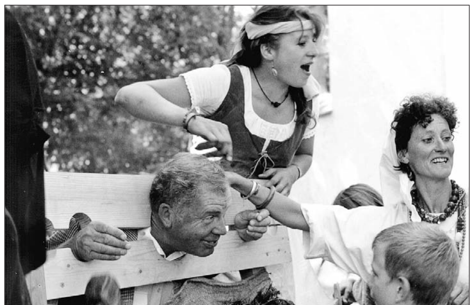
Der Henker führte sein Opfer zur Richtstätte