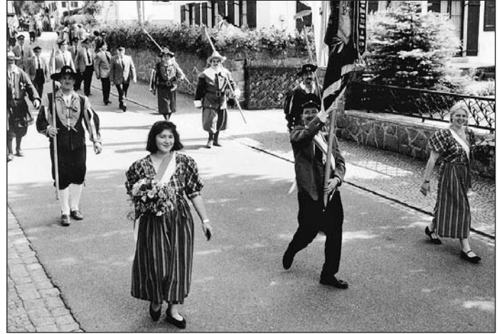
die Krieger- und Soldatenkameradschaft wehrhaft, .....