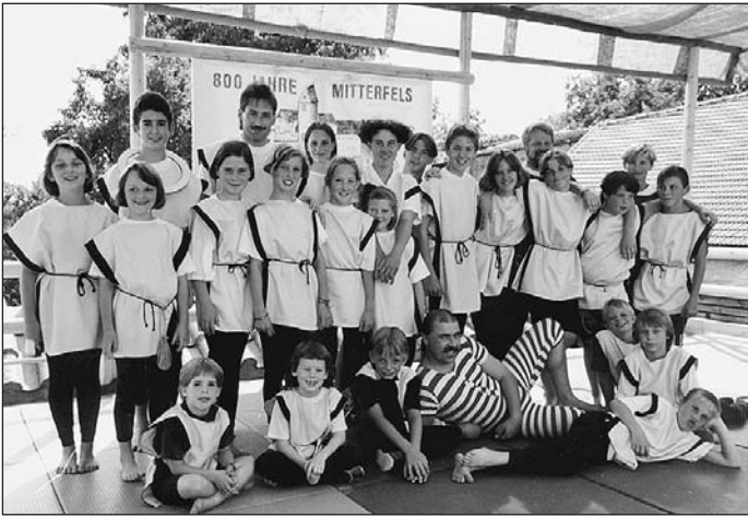
Die Akrobaten und Jongleure der TSV-Jugend