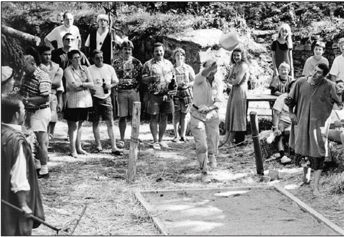
Das Steinstoßen im Burgzwinger erforderte Kraft