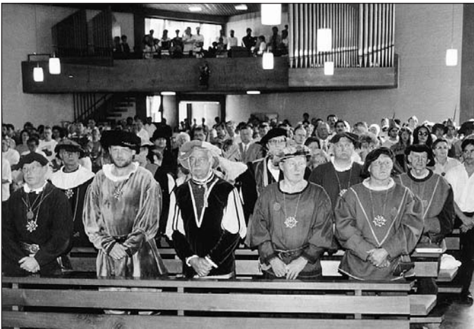
Beim Festgottesdienst am Sonntag war die Kirche voll