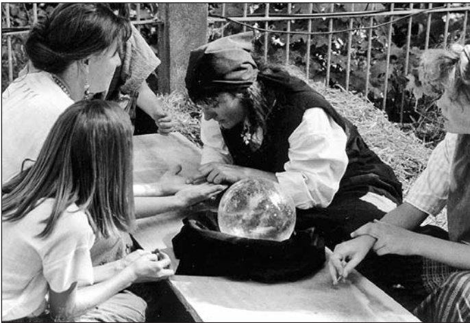
Im Zigeunerlager wurde aus der Hand gelesen