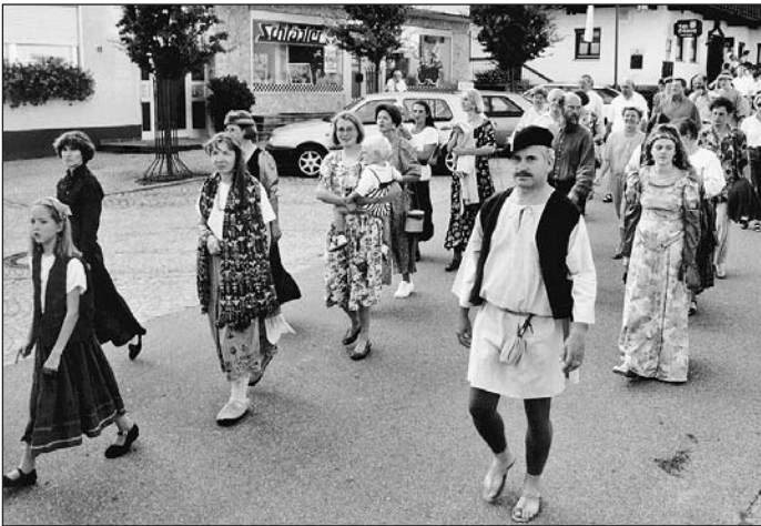
.....der Singkreis historisch und "neuzeitlich"