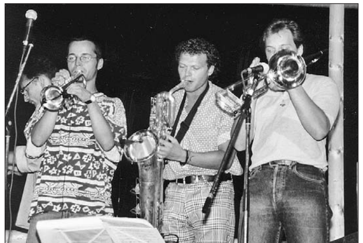
Mittelalterliche und moderne Musik (Jam Jar)