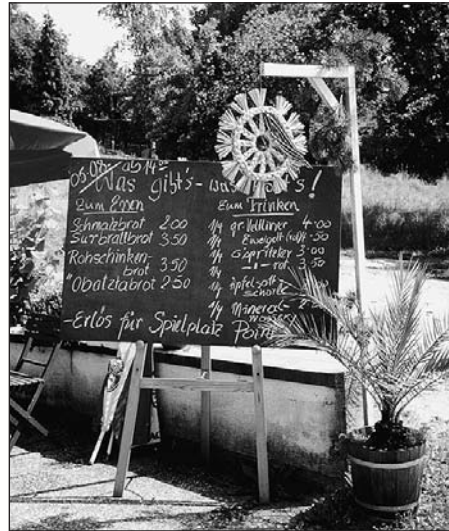
Die Buschenschenke in der Lindenstraße