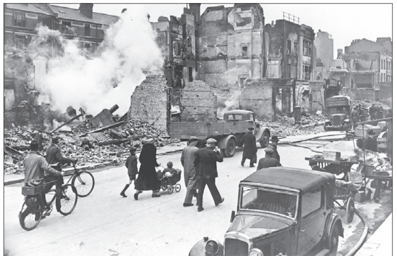
Als „Luftschlacht um England“ (10. Juli bis 31. Oktober 1940) bezeichnete die nationalsozialistische Propaganda die Vorbereitung einer Invasion Großbritanniens durch Angriffe aus der Luft. Um die Moral der Engländer zu brechen, wurden nicht nur militärische Objekte sondern auch Städte (Bild: London) durch deutsche Angriffe zerstört.

(Archival Research Catalog of the National Archives and Records Administration)