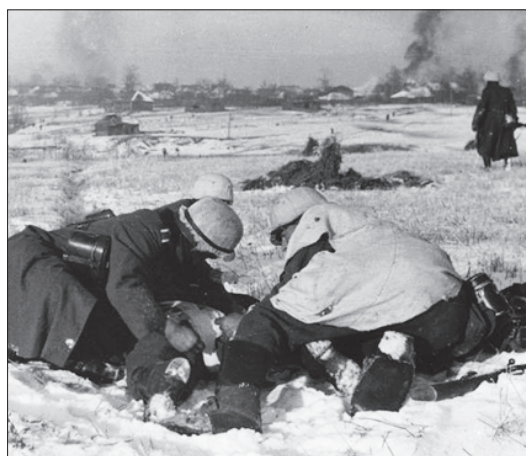
Deutsche Soldaten bei der Bergung eines Verwundeten in Russland im November 1941

(Archival Research Catalog of the National Archives and Records Administration)