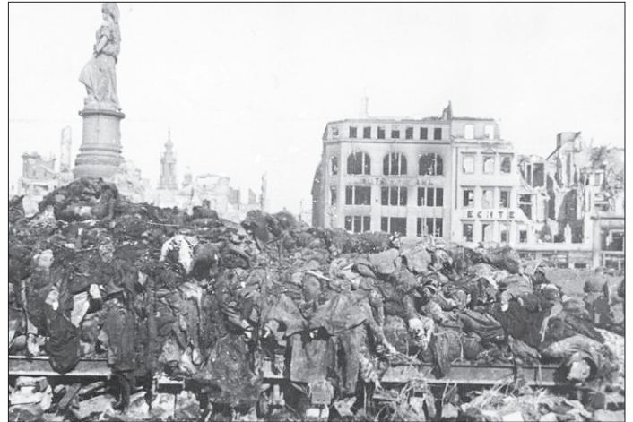
In den letzten Kriegsmonaten wurden zahlreiche deutsche Städte großflächig zerstört, darunter Braunschweig, Dresden, Heilbronn, Koblenz, Pforzheim, Hanau und Würzburg. Foto: Leichenberge nach den Luftangriffen vom 13. und 14. Februar 1945 in Dresden, dahinter Ruinen zerstörter Gebäude