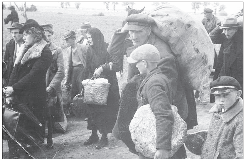
Jeder Krieg zerstört die Lebensgrundlage der Bevölkerung: Aussiedlung der polnischen Bevölkerung im deutsch besetzten Wartheland, 1939

Weil Verbote bekanntlich dazu da sind um übertreten zu werden, so näherte ich mich diesen „Feinden“. Ich hob eine Birne vom Boden auf und biss hinein. Durch Handzeichen ermunterte ich die „Feinde“, doch auch eine Birne vom Boden aufzuheben. Diese Geste war nicht ganz uneigennützig, denn ich wusste, dass einer dieser Offiziere in Waxenberg einem Mädchen eine halbe Tafel Schokolade geschenkt hatte. Der Wächter bemerkte dieses „Anbandeln“, unterband jede weitere Annäherung und forderte seine Gefangenen zum Weitermarsch auf. Der Offizier zuckte lächelnd die Schulter, als hätte er meinen Gedanken gelesen: „Schad, schee waar's gwen!“