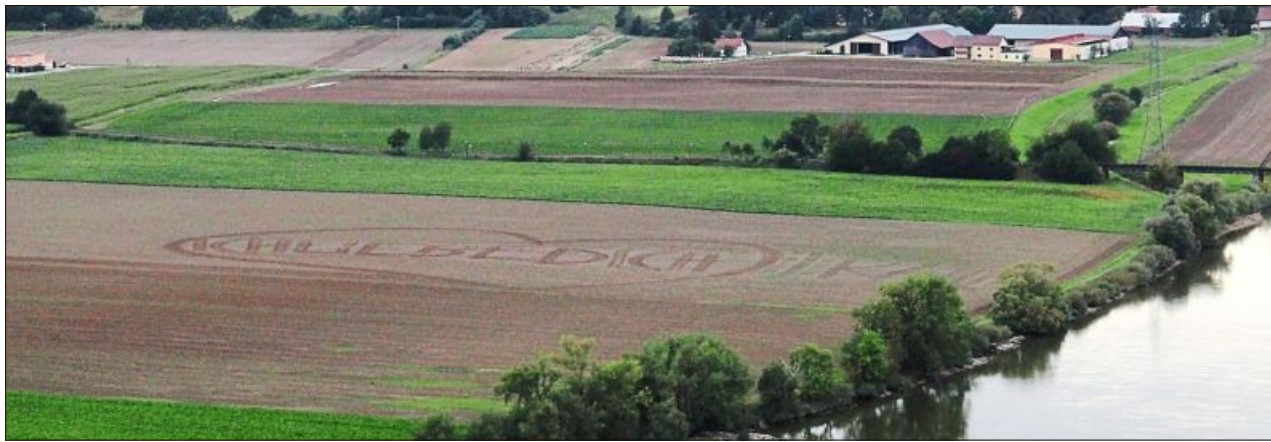
Gibt es eine romantischere Liebeserklärung als ein gegrubbertes „Ich liebe Dich“?