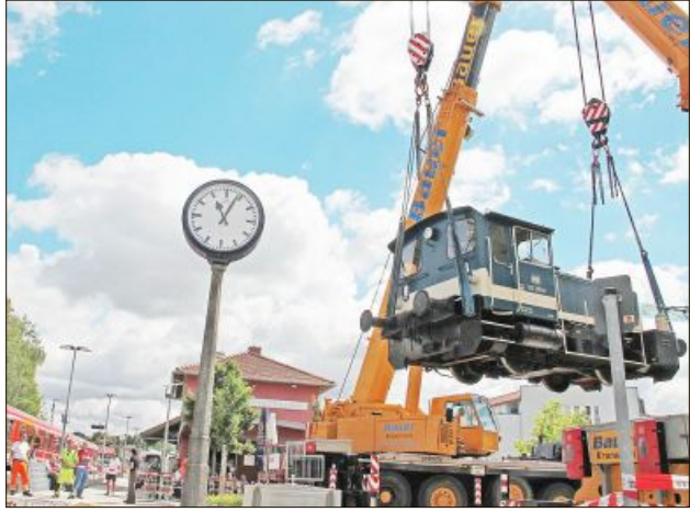
Eine Diesel-Lok schwebt ein.