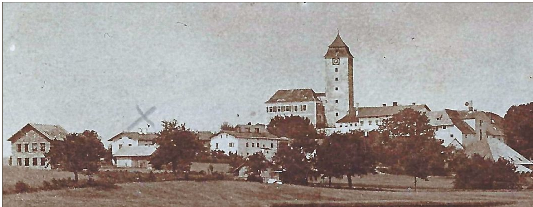
Die alte Ortsansicht mit Neubau des Schulhauses (ganz links), aufgenommen im Jahre 1887, ist in dem Buch enthalten.