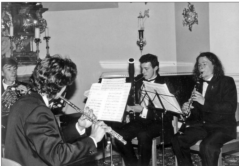
Abschlusskonzert 1996 in der St. Georgskirche: Bläserquintett der Akademie TIJI UNESCO