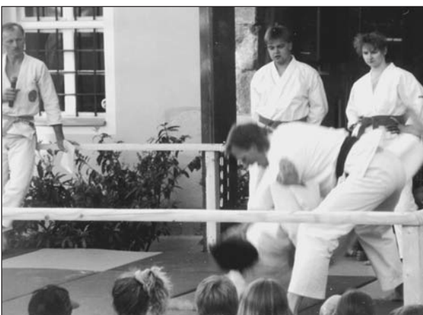
Vorführungen der Selbstverteidigungsgruppe der Judoabteilung