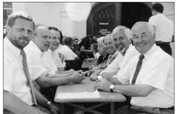
Frühschoppen mit Blaskapelle des Musikvereins