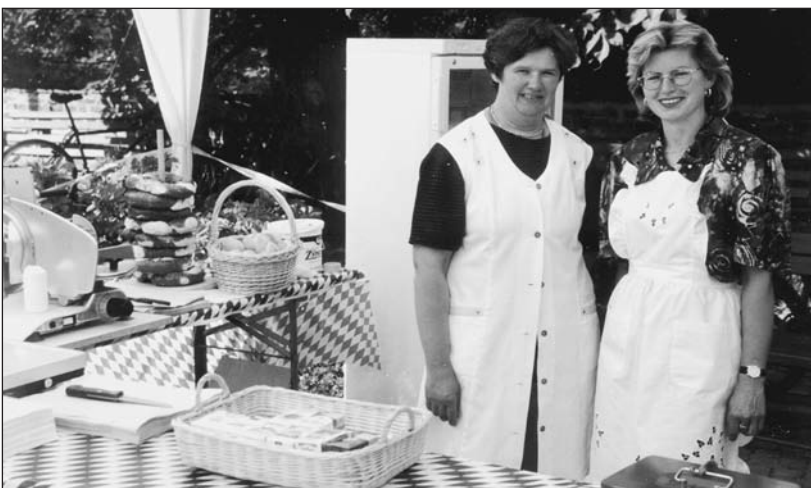
...die Abt. „Tischtennis“ für bayerischen Käse, „Tennis“ für Eis...

Für die Bewirtung sorgten die Abteilungen