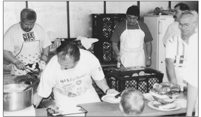
...die Skiabteilung hatte ein Cafe-Zelt aufgebaut, die Fußballer sorgten für Grillspezialitäten, die Triathleten für Gulaschsuppe (kein Foto!).