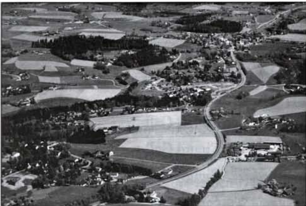
...und stellen die Geschichte hinein in moderne Gegenwart. Sie bekommen im Laufe der Jahre ein fast lückenloses Luftbildmosaik unserer Verwaltungsgemeinschaft.