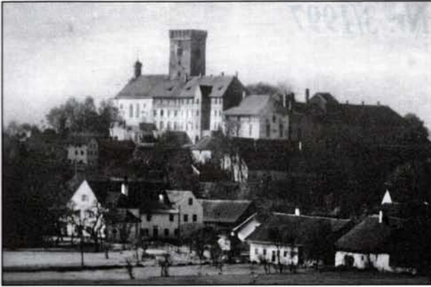
Wir spüren der Geschichte nach...

„Tradition heißt nicht, die Asche aufheben, sondern die Flamme weiterreichen.“ Ricarda Huch