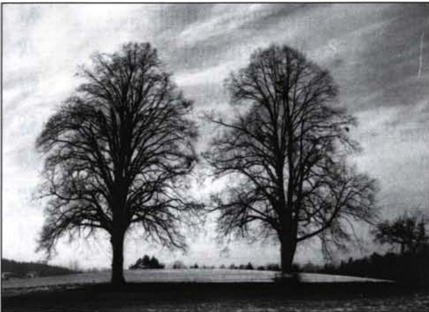
Wir zeigen die Schönheit unserer Heimat.