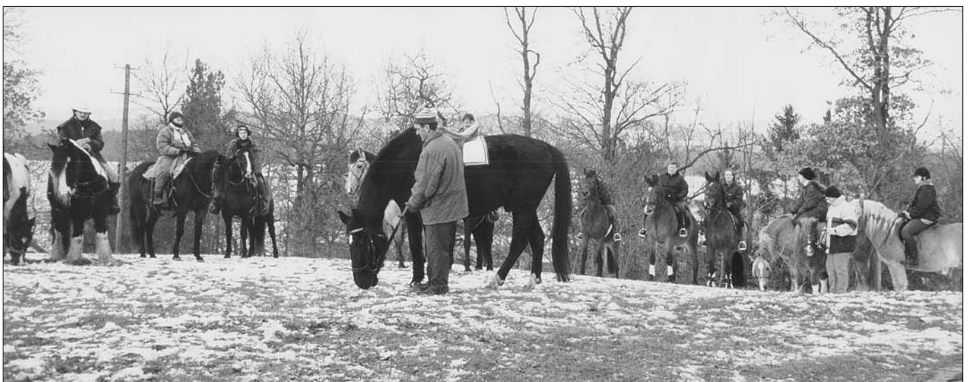
Pferdewallfahrt am Stephanitag (26. Dezember) 1998 nach Kapflberg