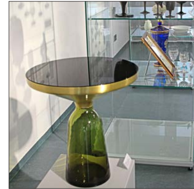
Star des modernen Designs bei Poschinger: „Bell Table“.