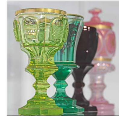
Glaspokale aus Uran, Rothyalith und Alabaster, um 1850.

Bis 4. November in Frauenau, geöffnet Di.–So., 9 bis 17 Uhr.