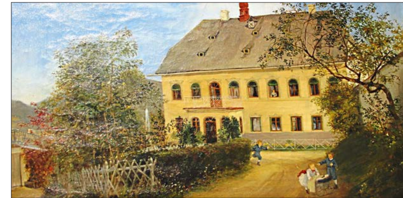
Herrenhaus der Poschinger i, Öl a.L., 1875, Künstler unbekannt.