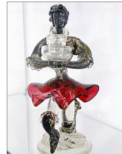
Kerzenhalter , freihandgeformt, vermutlich 1980er Jahre.