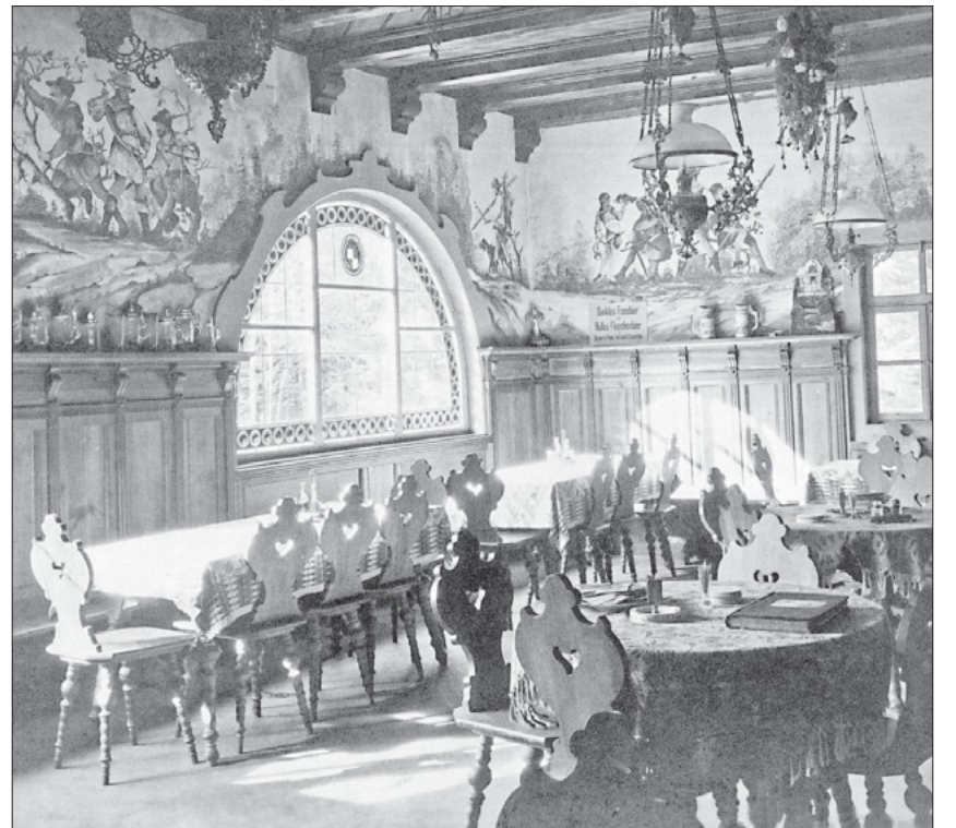
Der stattlich ausgestattete Speisesaal.